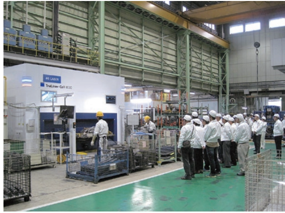
レーザー加工機の見学

2018年11月、羽村事業所及びGTL（ジーテクト東京ラボ）において、羽村市教育委員会主催の市民向け工場見学会を行いました。当日は17名の方にご参加いただきました。参加していただいた方からは「ジーテクトの事をよく知ることができた。」「プレス機の迫力に圧倒された。」「作業環境が整っていた。」などのご意見を頂きました。今後もこのような機会を設け、地域の方々とのエンゲージメントを図っていききたいと思います。