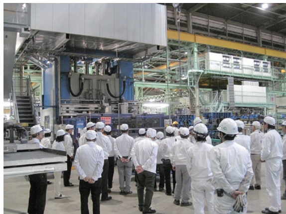
ホットスタンプの見学