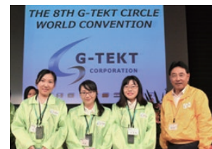
E掃而光サークルの皆さん

全世界から選抜されたQCサークルが一堂に会い、G-TEKTサークル世界大会を開催しています。8回目となる2018年度大会では、APAC(中国拠点)のE掃而光サークルがハイエストアワードを受賞しました。世界大会初となる海外拠点のハイエストアワード受賞です。一般購入品管理システムをゼロから自社開発し、導入しました。その結果、11.5時間掛かっていた作業時間を88%削減させることができました。また、同じ中国にある拠点ではシステムの水平展開を行いました。