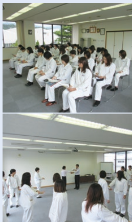
防犯安全講習会の様子

滋賀工場では初の試みとして女性従業員を対象とした防犯講習会を行いました。講師として甲賀警察署生活安全課の方にお越しいただき、25名が参加しました。女性が被害に遭いやすい犯罪の紹介や対処法の他、実践を通して護身術を学びました。