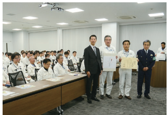
感謝状受賞の様子

通勤や出張時の交通ルール遵守はもとより、長期休暇前には若年層への交通安全講習を行っております。また、羽村地区は昨年度に引き続き、交通安全に積極的に取り組んだ功労に対し、警視庁から感謝状を頂きました。羽村地区では安全意識向上のため、「春の交通安全講習」及び「秋の交通安全講習」を実施しています。